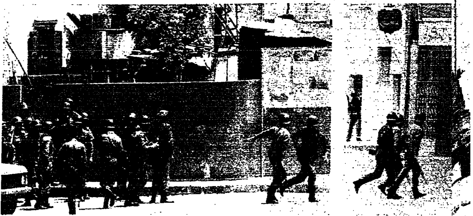
الشرطة يسارعون لخط مراكزهم